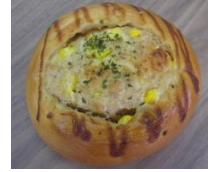
ツナコーンマヨ 140円