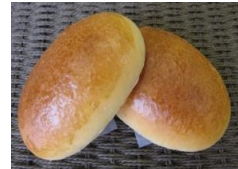
塩バターパン (2個入)100円