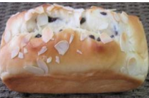
チョコチップロール 230円