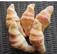
クロワッサン (5個入)230円