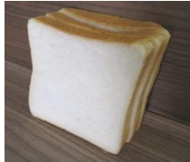
食パン半斤 (4・6・8枚切)100円