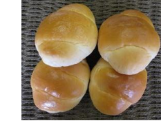
テーブルパン (4個入)150円