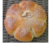
くすみあんぱん 120円