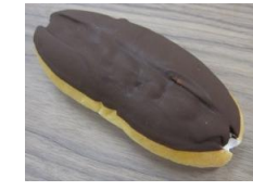
チョコホイップ 120円