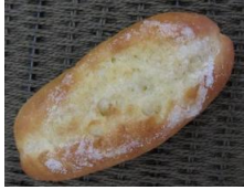
シュガーバターコッペ 100円