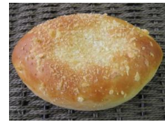
スパイシーキーマカレー 120円