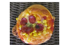
サラミ&コーンピザ 120円