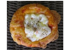
ポテトサラダピザ 120円