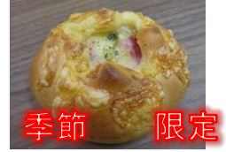
オニオンベーコンチーズ 140円