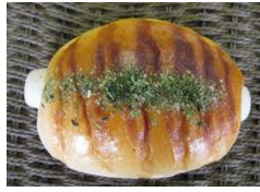
チーズちくわパン 120円