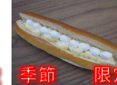
りんごクリーム&ホイップ 120円