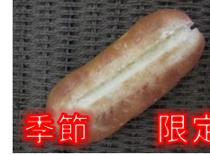
ミルクフランス 140円