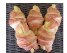
チーズワッサン (5個入)280円