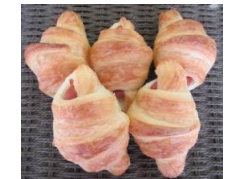
ウイナーワッサン (5個入)280円