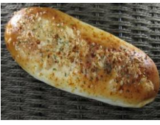
甘ロビーカレー 120円