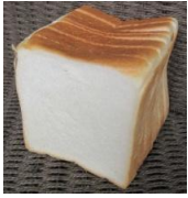
食パン(4・6・8枚切) 200円