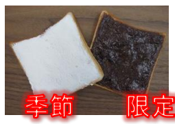
チョコランベリー&ホイップ 150円