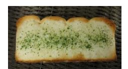
ガーリックトースト 120円