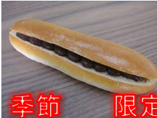
チョコ&ランベリー 120円