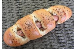
マスタードウイナー 140円