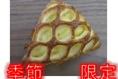
りんごクリームデニッシュ 120円