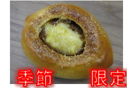
とろ〜りチーズカレー 120円