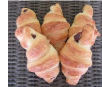
チョコワッサン (5個入)280円