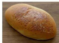
北インド風キーマカレー 130円