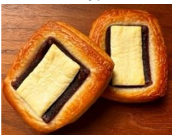
あんこクリームチーズ 220円