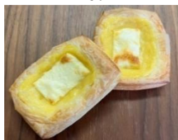
カスタードクリームチーズ 220円