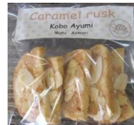
キャラメルラスク 130円