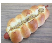
チョコリリーウイナー 130円