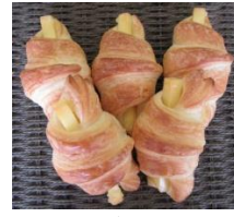
チーズワッサン (5個入)300円