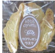
クロワッサンラスク 130円