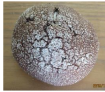
ココアメロンパン 130円