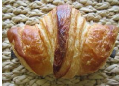
デカワッサン(チョコ) 130円