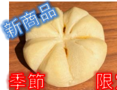
新商品 季節限定 かぼちゃクリーム 130円