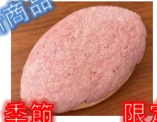
新商品 季節限定 紅いもメロンパン 130円