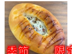
季節 限定 ジャーマンポテトパン 130円