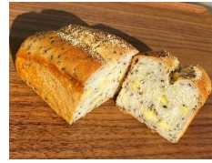
ゴマチーズ食パン 220円