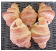
ウイナーワッサン (5個入)300円