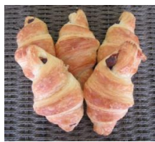
チョコワッサン (5個入)300円