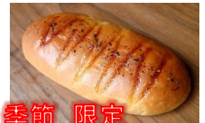
季節 限定 焼き鳥マヨ 130円