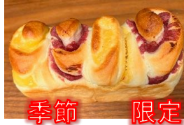
季節 限定 2色のさつまいもパン 220円