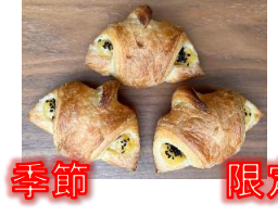
季節限定 さつまいもワッサン (3個入)180円