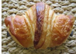
デカワッサン(チョコ) 130円