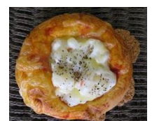
ポテトサラダピザ 130円