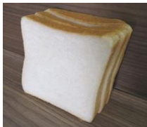
食パン半斤 (4・6・8枚切) 110円