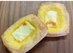
カスタードクリームチーズ 220円