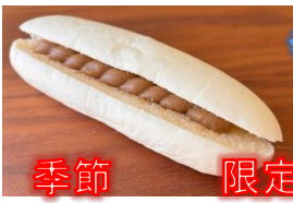
カフェラテクリーム 130円