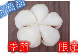
さくらあんぱん 130円