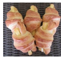
チーズワッサン (5個入)300円