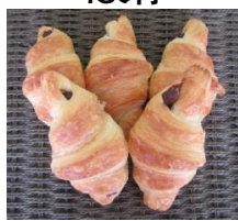
チョコワッサン (5個入)300円