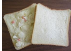
ポテトサラダサンド 130円