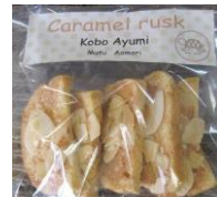
キャラメルラスク 130円