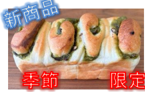
宇治抹茶小豆食パン 220円