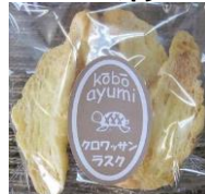
クロワッサンラスク 130円