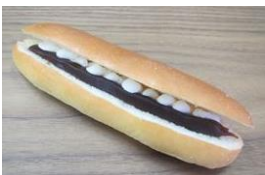
あんこホイップ 130円