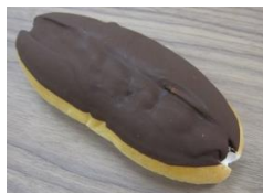
チョコホイップ 130円