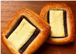
あんこクリームチーズ 220円