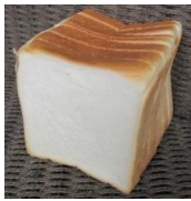
食パン (4・6・8枚切) 220円