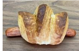
マスタードウイナー 150円