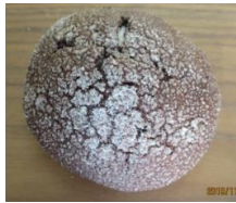
ココアメロンパン 130円