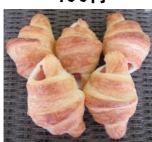
ウイナーワッサン (5個入)300円