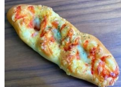
ウインナーチーズ 150円