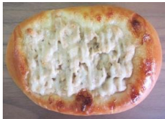
ツナマヨネーズ 110円