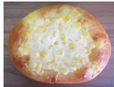
コーンマヨネーズ 110円