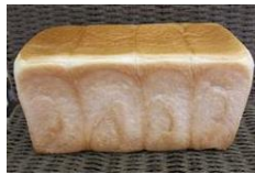
食パン無切 (2斤) 440円