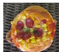
サラミコーンピザ 130円