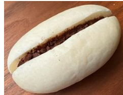
チョコと夏秋いちご 100円