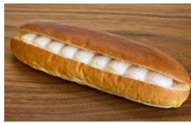
夏秋いちごのホイップクリーム 130円