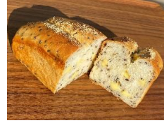
ゴマチーズ食パン 220円