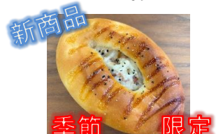
ジャーマンポテトパン 130円