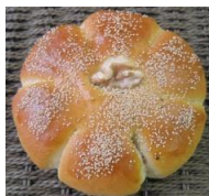
くるみあんぱん 130円