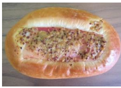
ベーコンマスタード 110円