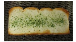
ガーリックトースト 130円