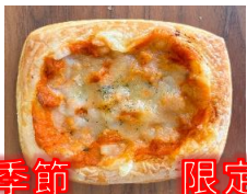
トマトチキンデニッシュ 130円