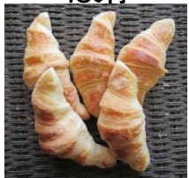
クロワッサン (5個入)250円