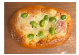
ベーコン枝豆チーズ 150円