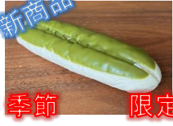
季節限定 抹茶ホイップ 130円