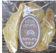
クロワッサンラスク 130円