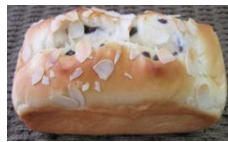
チョコチップロール 270円