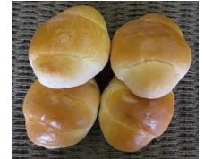
テーブルパン (4個入) 160円