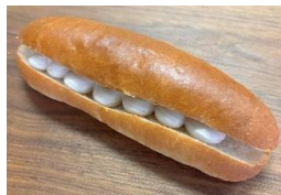
カフェラテホイップサンド 130円