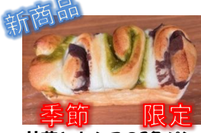
新商品 季節限定 抹茶とあんこの2色パン 220円