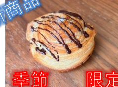
季節限定 クロフィン 130円