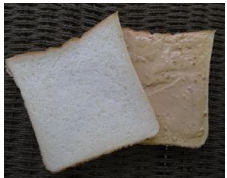
ピーナッツホイップ 130円