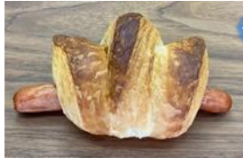
マスタードウイナー 150円