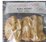
キャラメルラスク 130円