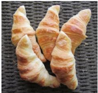
クロワッサン (5個入) 250円