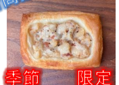
季節限定 ジャーマンポテトテニッシュ 130円