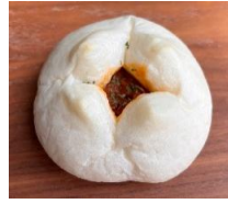
バターチキンカレー 130円