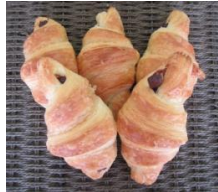
チョコワッサン (5個入) 300円