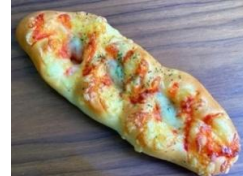
ウインナーチーズ 180円