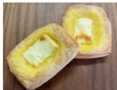
カスタードクリームチーズ 220円