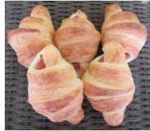
ウイナーワッサン (5個入) 300円