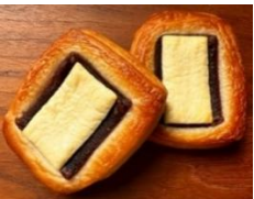
あんこクリームチーズ 220円