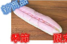
季節限定 イチゴホイップ 130円