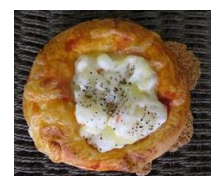
ポテトサラダピザ 130円