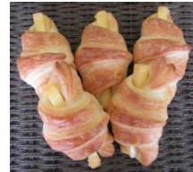
チーズワッサン (5個入) 300円